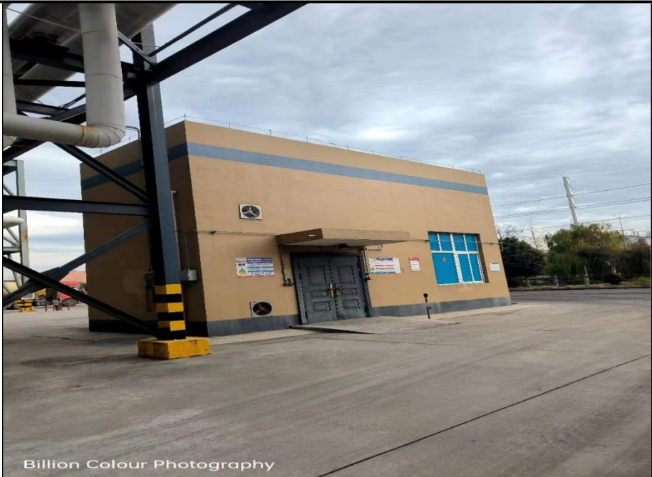
Billion Colour Photography