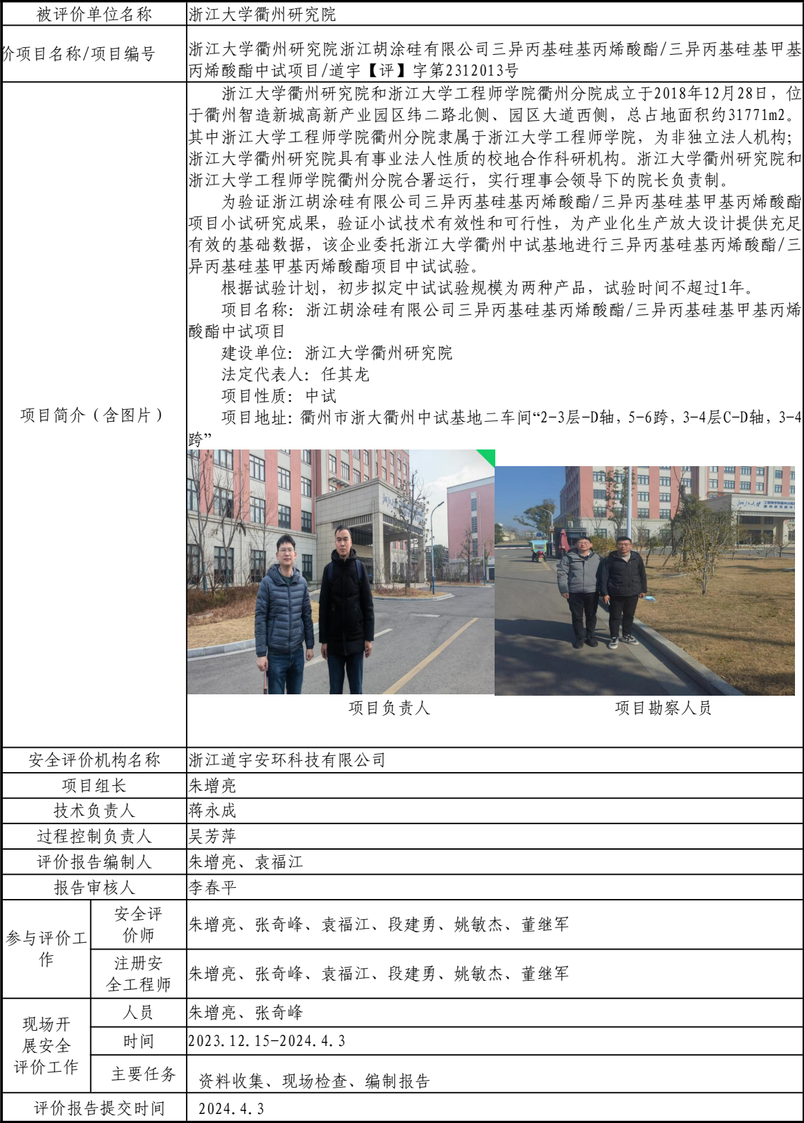
安全评价报告信息公开表格（浙江大学衢州研究院）