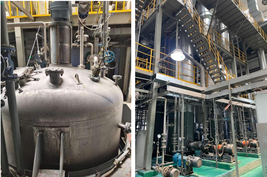
图3：合成车间反应釜