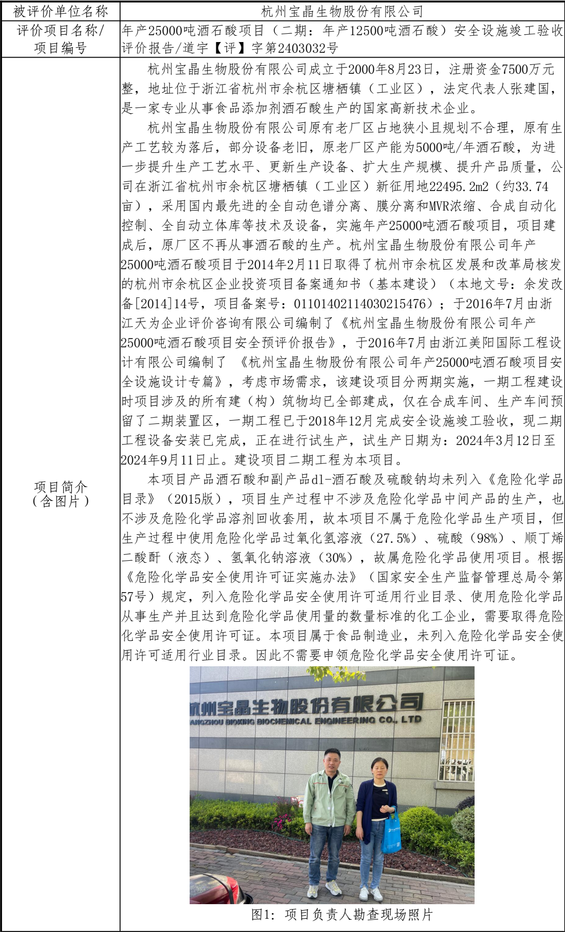
图1：项目负责人勘查现场照片