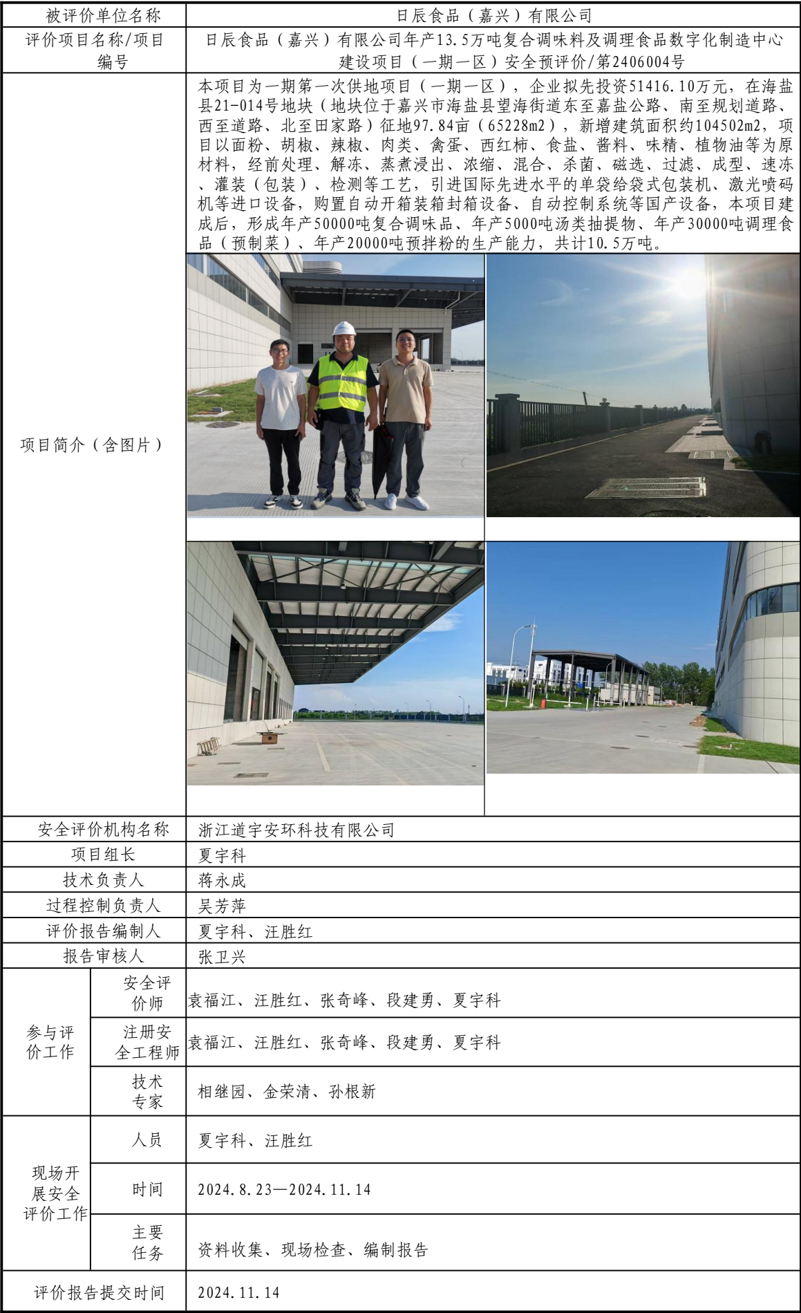
安全评价报告信息公开表格（日辰食品（嘉兴）有限公司）