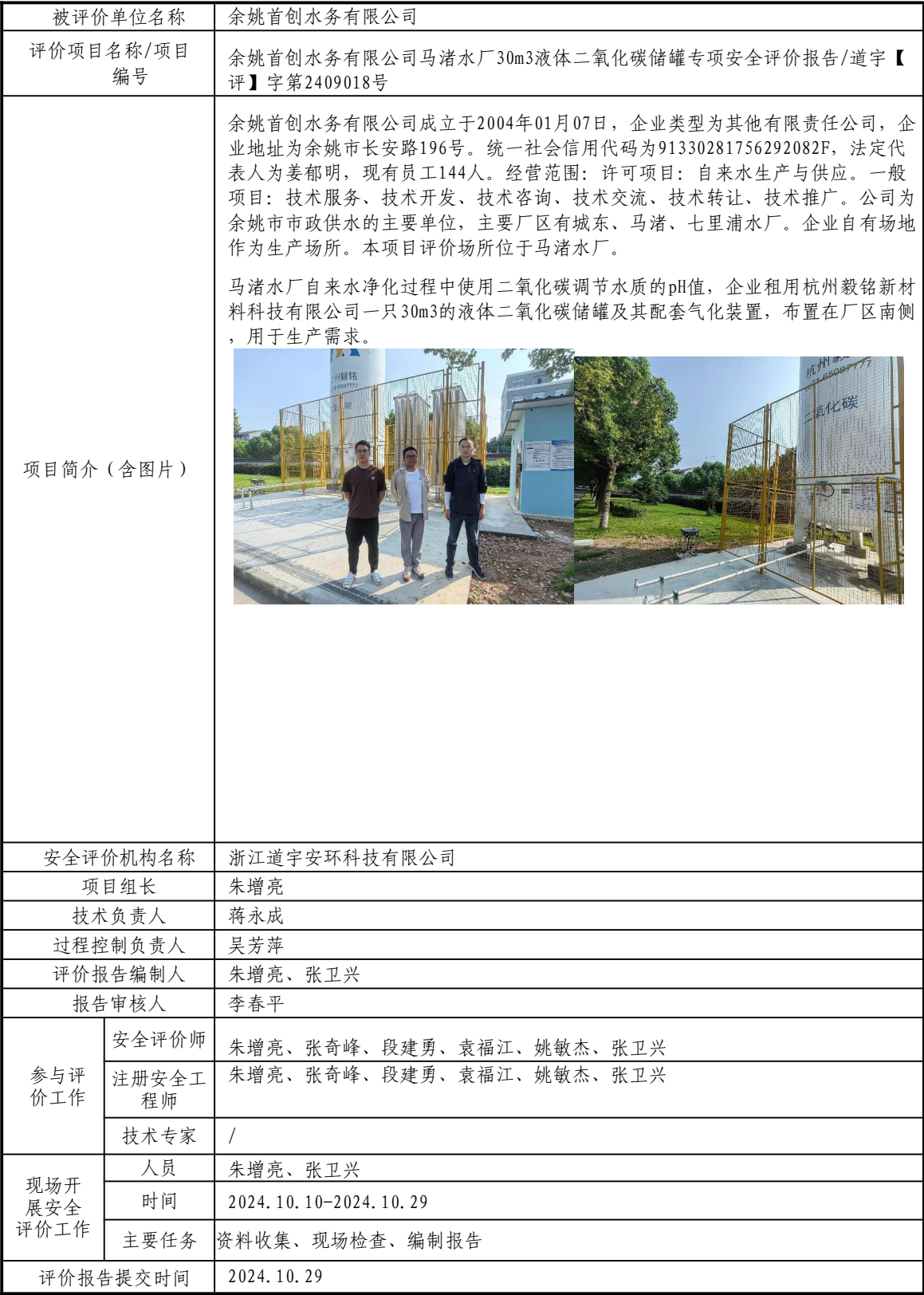
安全评价报告信息公开表格（余姚首创水务有限公司）