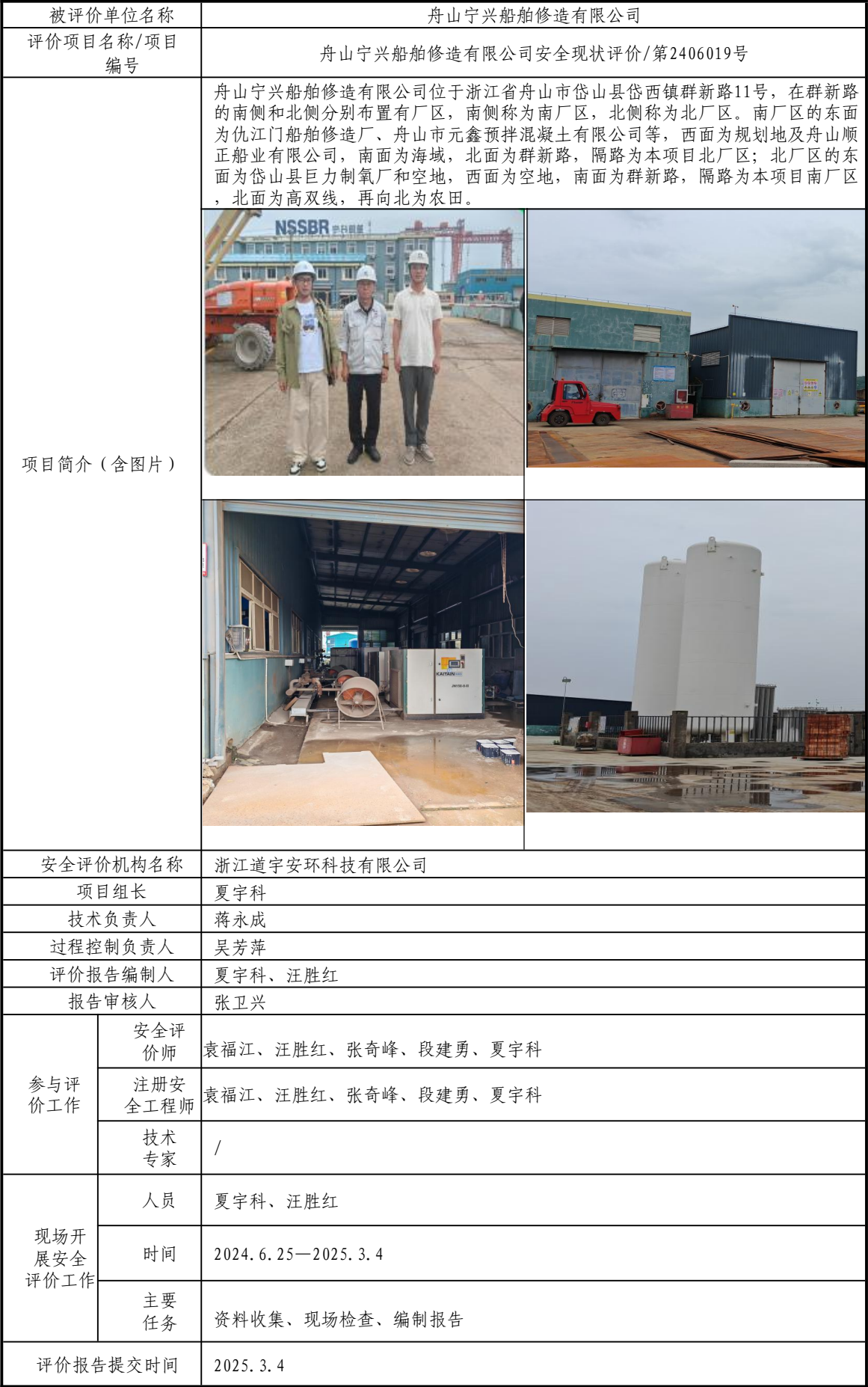
安全评价报告信息公开表格（舟山宁兴船舶修造有限公司）