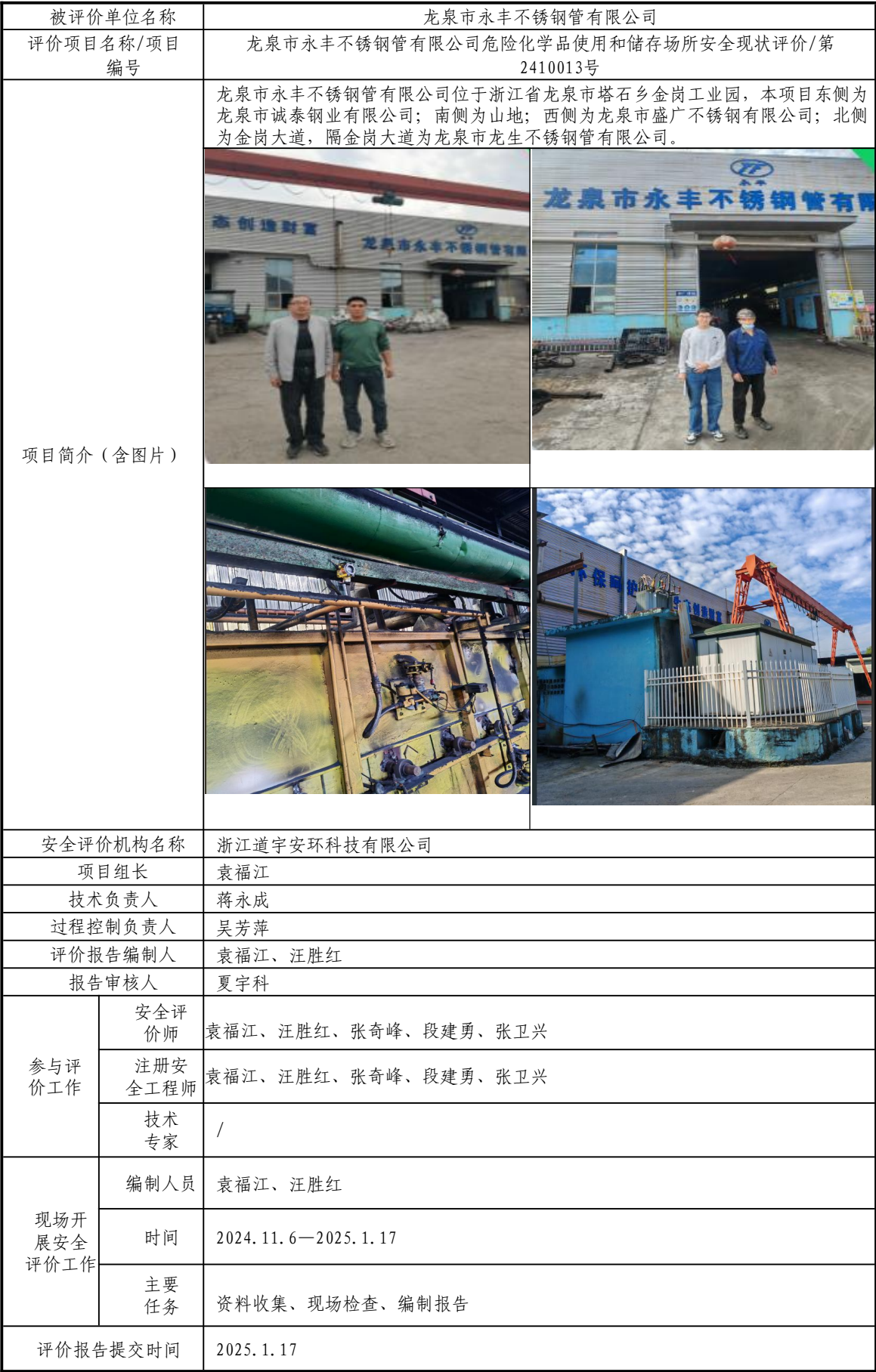
安全评价报告信息公开表格（龙泉市永丰不锈钢管有限公司）