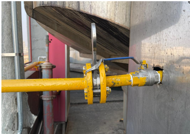
图4：天然气管道8字盲板