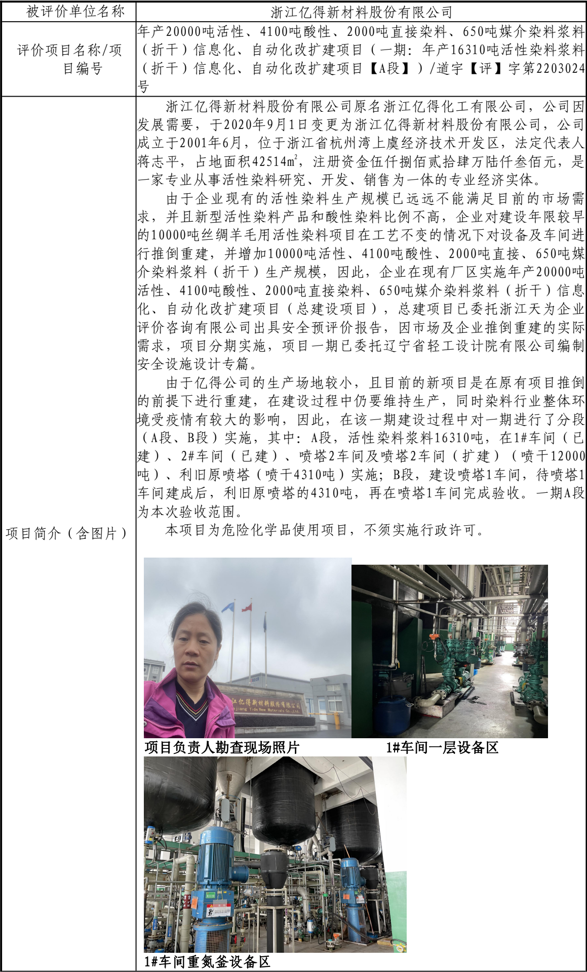
项目负责人勘查现场照片