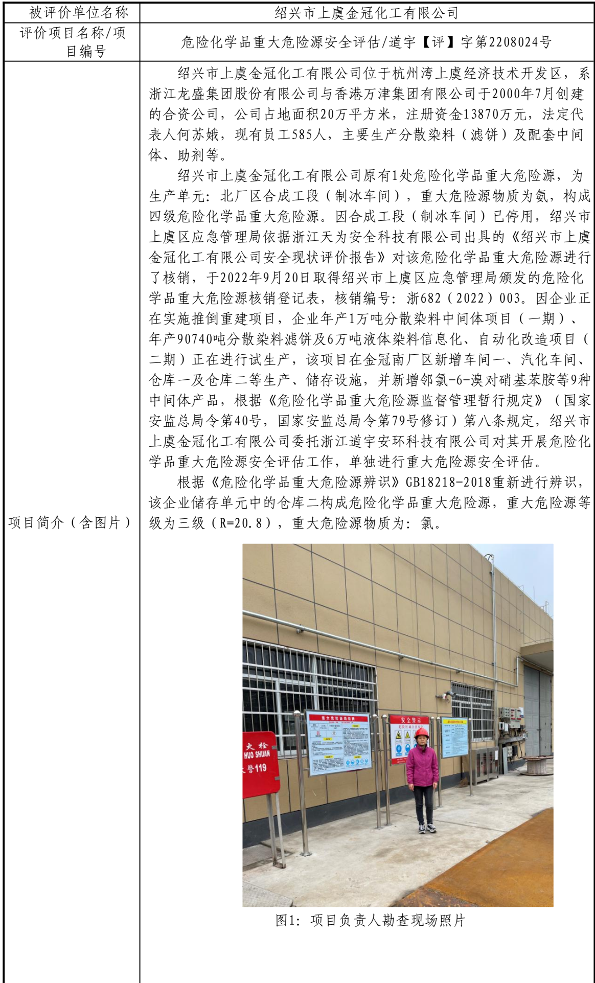
图1：项目负责人勘查现场照片