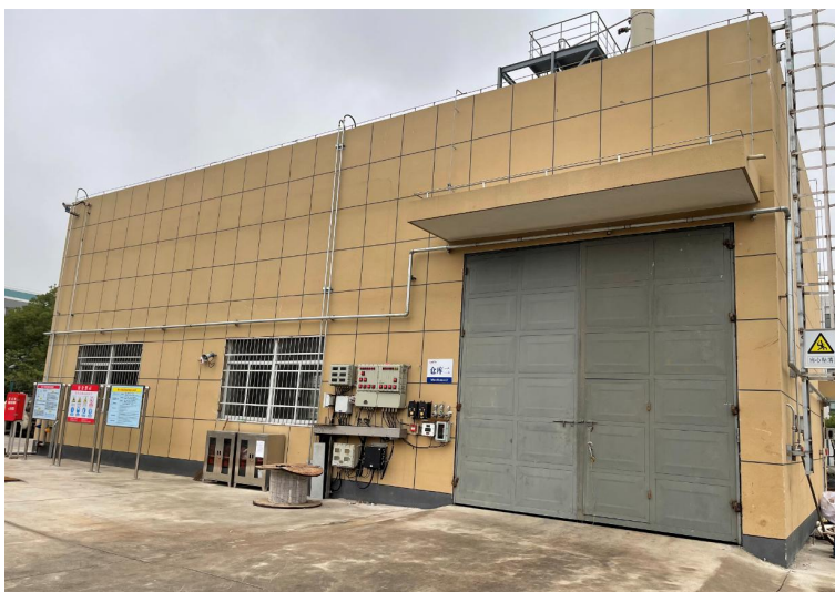
图2：重大危险源仓库二外立面