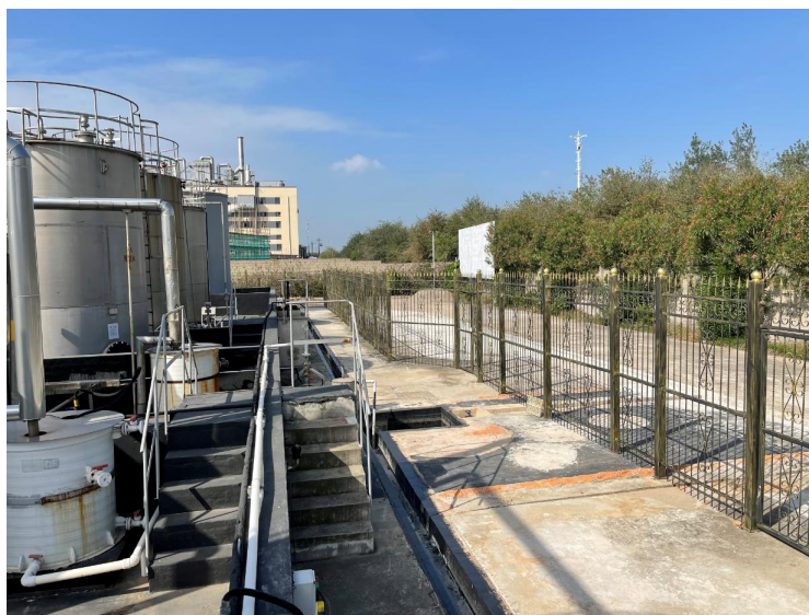
图3：重大危险源罐区北侧