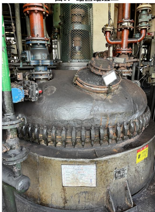
图4：合成车间一碘化釜