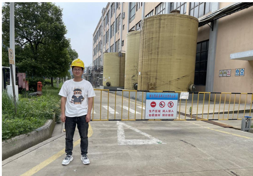
图2：项目组成员勘查现场照片